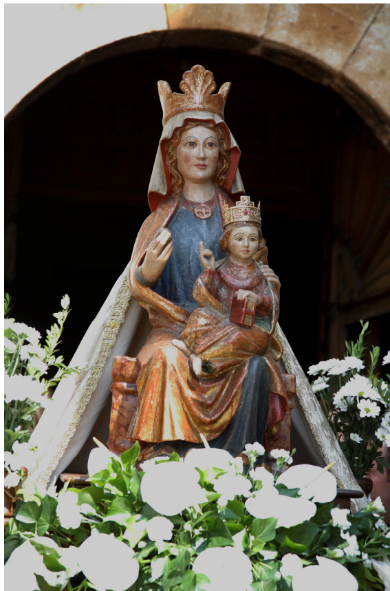
(N.S. del Castillo en procesión, el 15 de agosto)

También se encuentra una rica colección de pergaminos y documentos (testamentos, herencias, genealogías...) relacionados con la familia Gutiérrez de Mier y otras familias importantes de Cervera que reflejan su influencia en la villa y sus entornos.