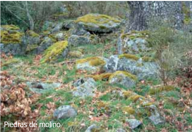
Piedras de molino

por los canteros y luego desplazadas por la pendiente, con la consiguiente fractura de alguna de ellas, quedando los restos como un recordatorio de la labor de estos artesanos. Salimos al claro en una zona de media ladera de espectaculares vistas donde también podemos fijarnos en los nódulos que aparecen en la roca. Cruzaremos otra pasarela de madera y avanzando un poco más se llega a la campa de Colla Cobre desde donde en un día despejado se tiene una bonita vista de los Picos de Europa. Tomaremos dirección a la izquierda y atravesaremos dicha campa para coger una pista que desciende por el interior de un robleal hasta el punto en el que nos desviamos en nuestro camino de ascenso. Una vez allí el regreso al aparcamiento no tiene pérdida ya que sólo queda desandar el primer tramo del recorrido. Este recorrido supone un total de 13 Km, entre ida y vuelta, permitiendo conocer sin demasiado esfuerzo una de las zonas más interesantes del Parque Natural de Fuentes Carrionas y Fuente Cobre-Montaña Palentina.