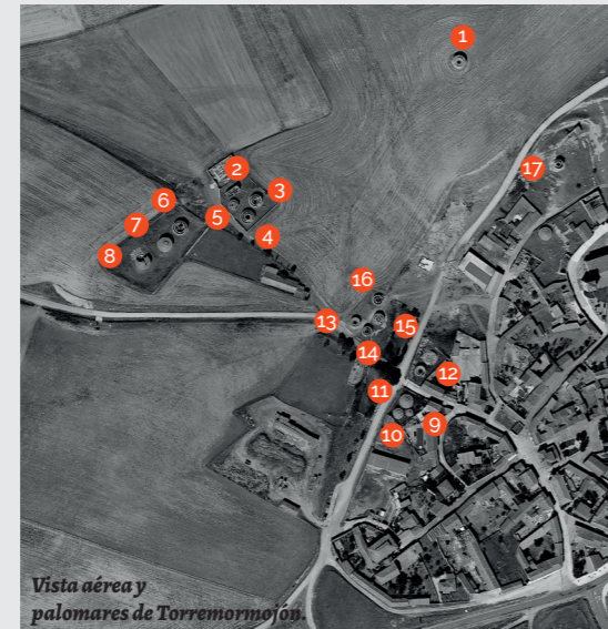
Vista aérea y palomares de Torremormojón.