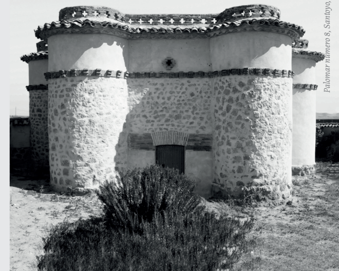
Palomar número 8, Santoyo, Ruta Este.