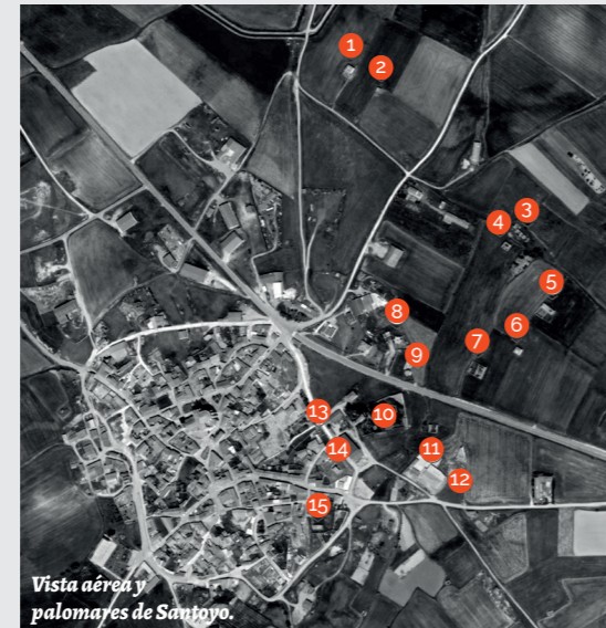
Vista aérea y palomares de Santoyo.