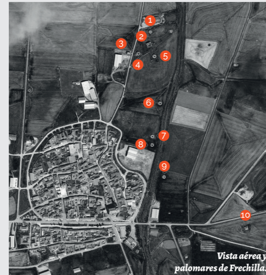
Vista aérea y palomares de Frechilla.