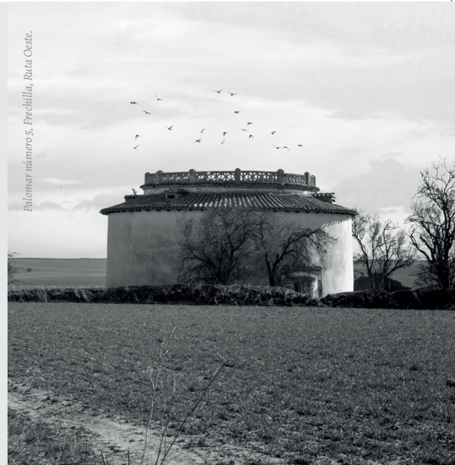
Palomar número 5, Frechilla, Ruta Oeste.

En nuestra provincia se contabilizan hasta 1000 palomares. Muchos de ellos pueden entenderse como un conjunto monumental e identificador, cuya desaparición supondría una pérdida irreparable de identidad del municipio y del territorio. Documentar, caracterizar y divulgar estos conjuntos, es un paso para su preservación y conservación.