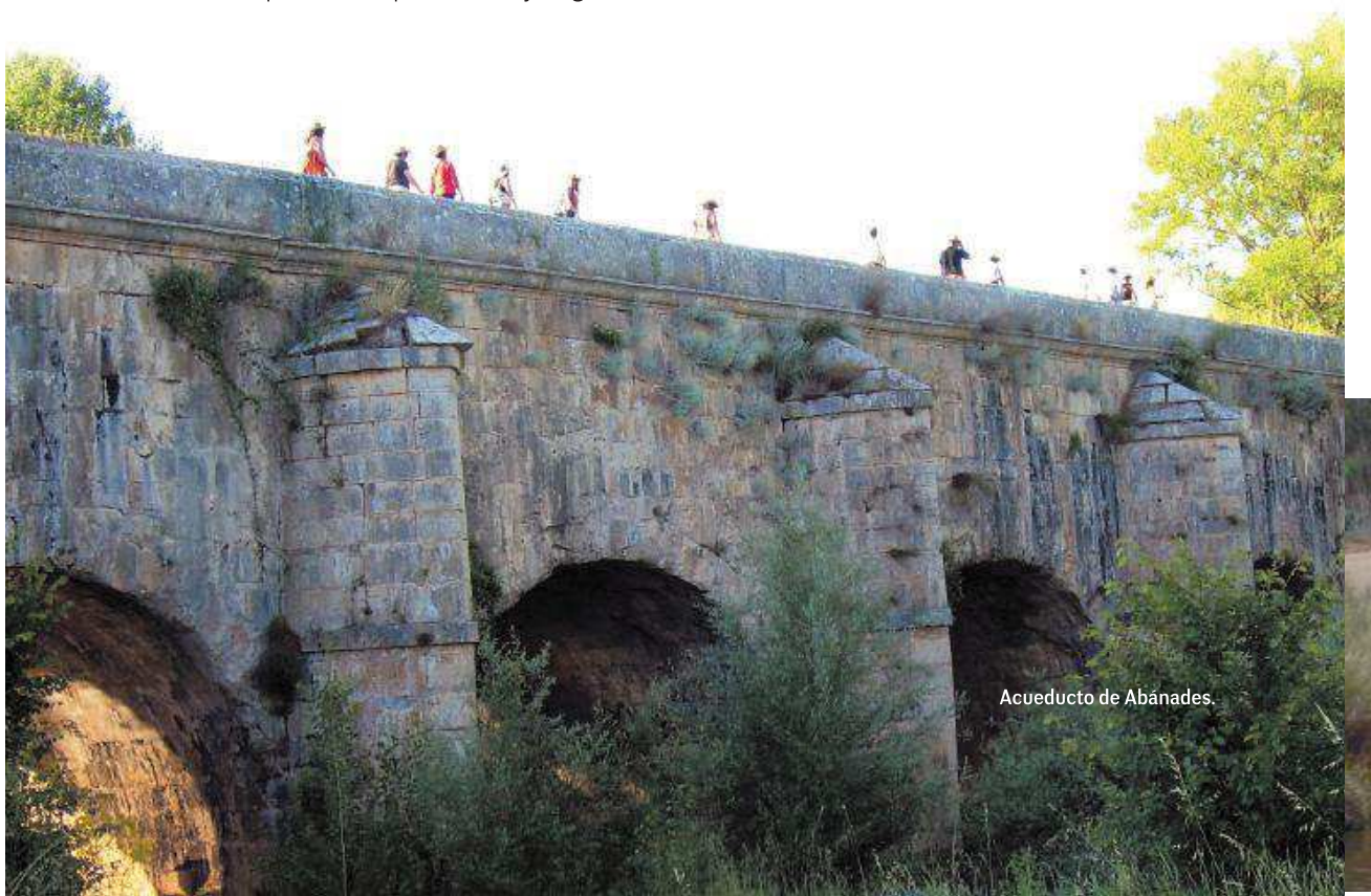
Acueducto de Abánades.

Una vez visitado el conjunto de la Presa del Rey nos acercamos a la 2ª retención, conocida como la “Retención de San Andrés”, que sirve para impedir la inundación del Canal con las aguas del Pisuerga y es otro ejemplo más de la ingeniería del siglo XVIII. Su piedra roja se puede divisar desde la carretera. Retomamos la ruta por el Canal, margen izquierdo, y a poco más de 1 km llegamos a la esclusa 7 y a las ruinas del batán del Rey. Continuamos por el margen izquierdo y alcanzamos Olmos de Pisuerga. Su doble esclusa, la 11-12, y sus edificios ruinosos nos muestran la actividad que el Canal tuvo en este punto. Un poco más y llegamos a Naveros, donde está la esclusa 13.