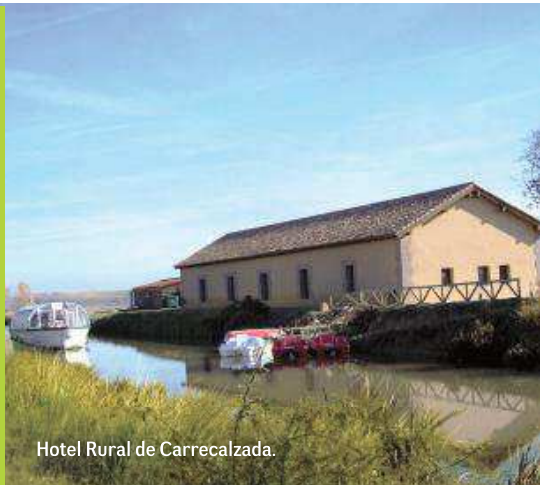
Hotel Rural de Carrecalzada.